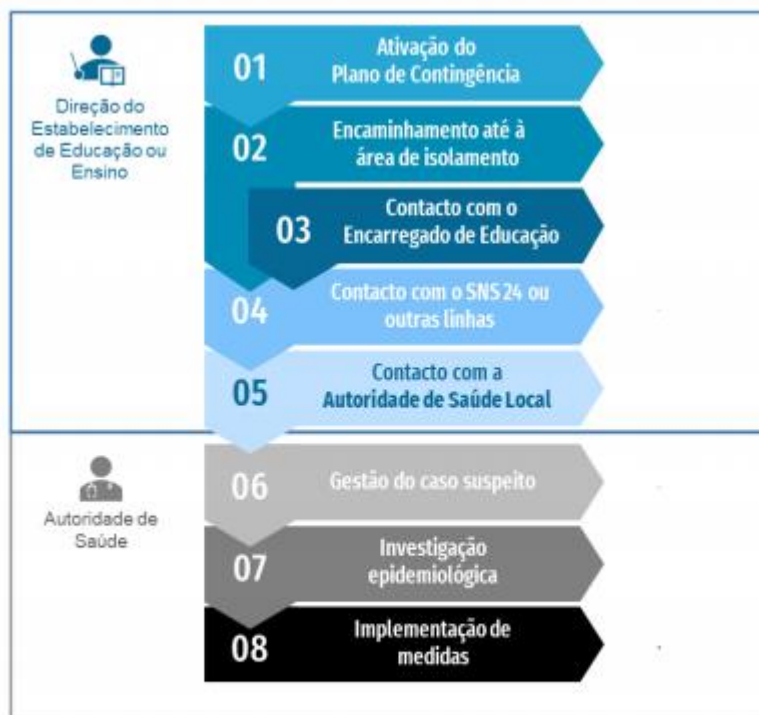
Figura 1. Fluxograma de atuação perante um caso suspeito de COVID-19 em contexto escolar

Perante a identificação de um caso suspeito, devem ser tomados os seguintes passos: