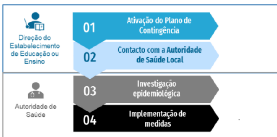
Figura 2. Fluxograma de atuação perante um caso confirmado de COVID-19 em contexto escolar

Se o caso confirmado tiver sido identificado fora do colégio, devem ser seguidos os seguintes passos: